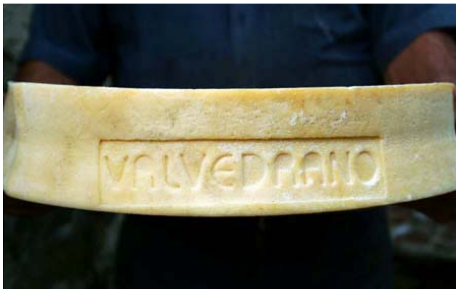
(le prime forme dell'alpe Val Vedrano, luglio 2006)

"Presidio SlowFood + nome alpeggio impresso sullo scalzo"